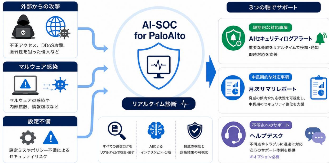
AI-SOC for PaloAlto サービスイメージ