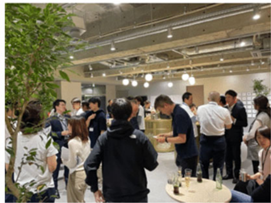
東京日本橋兜町・茅場町「FinGATE」コミュニティの様子

FinGATE 公式サイト： https://www.fingate.tokyo/