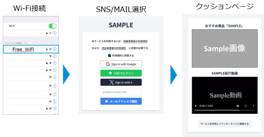
<認証画面イメージ>