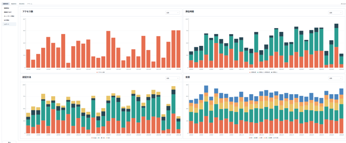
<アクセス分析画面イメージ>