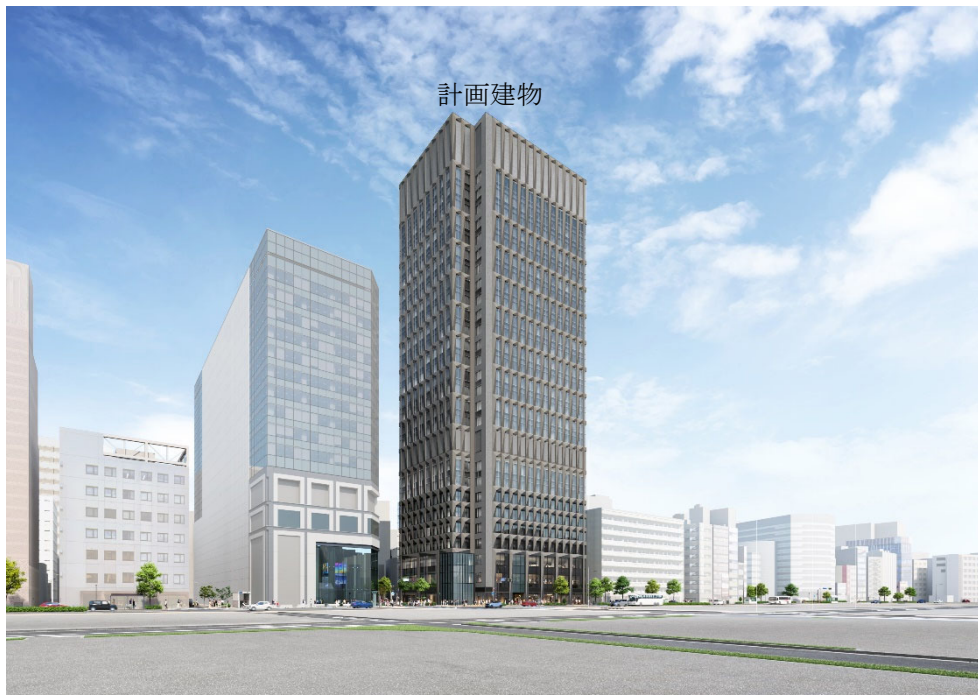
イメージパース 計画地南西方向（永代通り）より望む