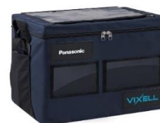
医薬品定温輸送ボックス「VIXELL」

パナソニックが開発した新素材「真空断熱管体：VIC (Vacuum Insulated Case)」により、頑丈かつ長時間の保冷輸送を実現します。また、多様な温度帯（2-8℃、15-25℃、-20℃以下、ドライアイス）にも対応しており、上市薬をはじめ、治験薬、再生医療等製品、検体の輸配送まで広範囲にサポートします。さらに、高水準の電波透過性により、IoT デバイスで収集した輸配送時の温度データの遠隔取得が可能となっています。