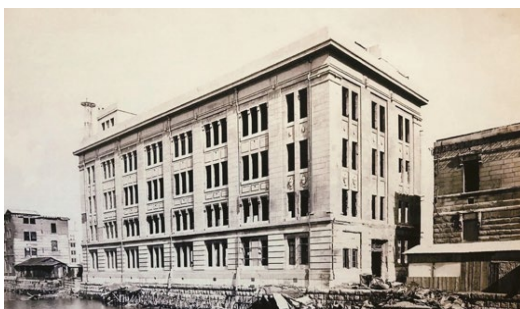
【1923年築の元第一国立銀行の建物】