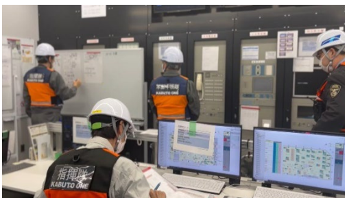
<帰宅困難者受入れ訓練中の防災センターの様子>