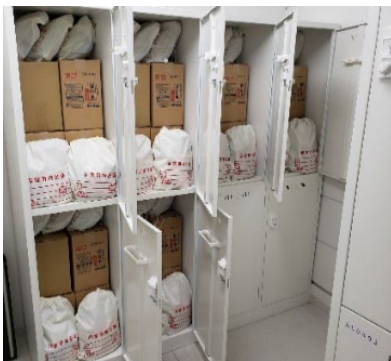
<「FinGATE」テナント用防災備蓄品>