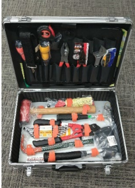
<移動式救助工具セット>