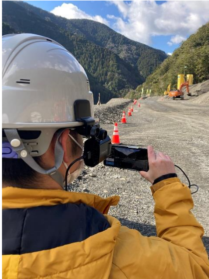
<現場側の利用イメージ>

通信環境の構築が課題とされていた不感地帯に高性能なネットワークを提供する「STARLINK BUSINESS」と、リモートで遠隔地の現場の作業が行える「Gレポート」により、移動時間の削減や効率的な人材活用など、僻地の建設現場の生産性向上を実現し、建設土木業のDX推進、課題解決へ貢献します。