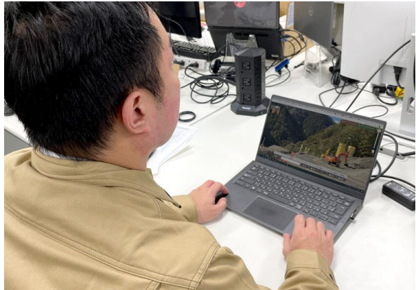
<管理側の利用イメージ>