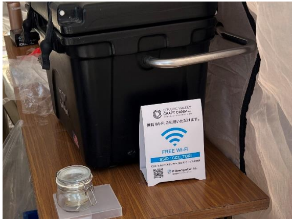
(飲食店ブースのポップスタンド)