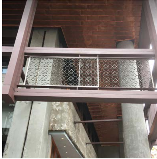
マリオンの間には旧銀行時代に設置されていた手摺を活用。当時の凝った意匠性の手摺を残しています。