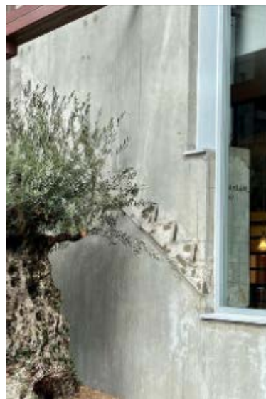
(写真上) かつての階段はそのまま残し、銀行時代の歴史を継承しました。