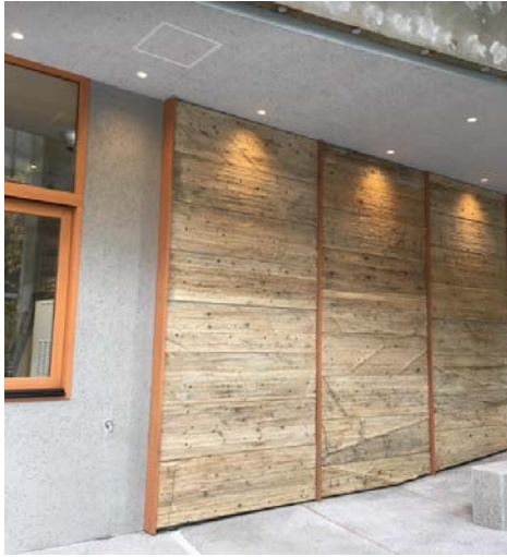
テラス部壁面の木材は、兜町再活性化プロジェクトエリア内に完成した「KITOKI」の型枠材を再利用。エリア内での資材の循環を表現しています。