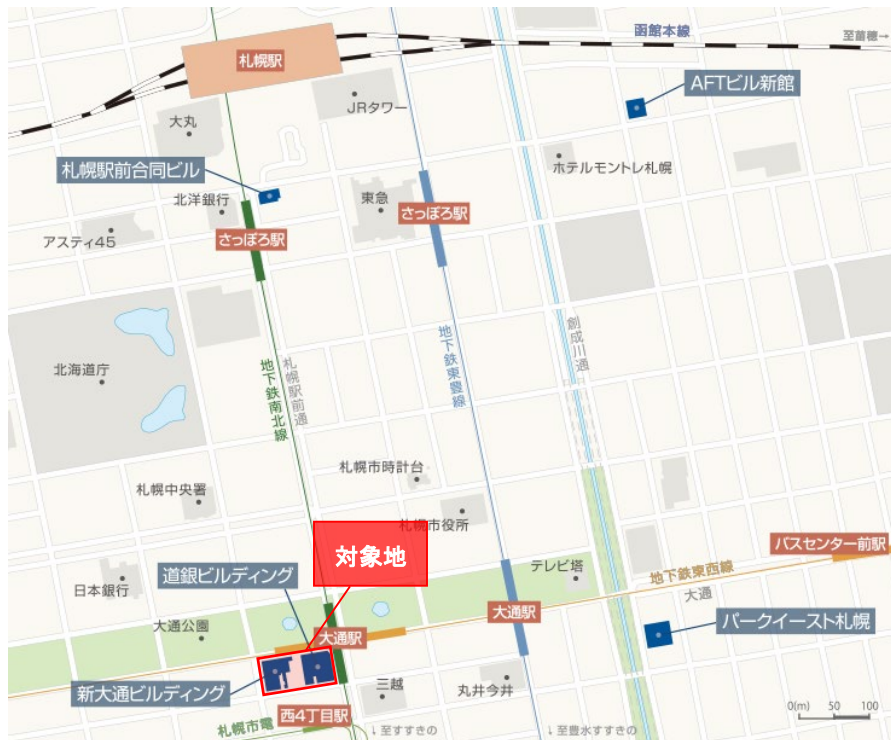
■ 当社グループ所有物件