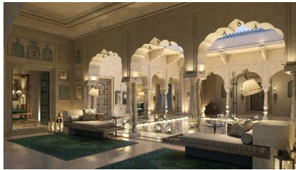
Fort Barwara by Six Senses (India)