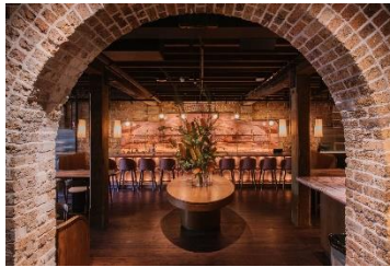
Hinchcliff House (Australia)