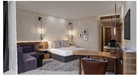
Sydney Olympic Park (Australia)