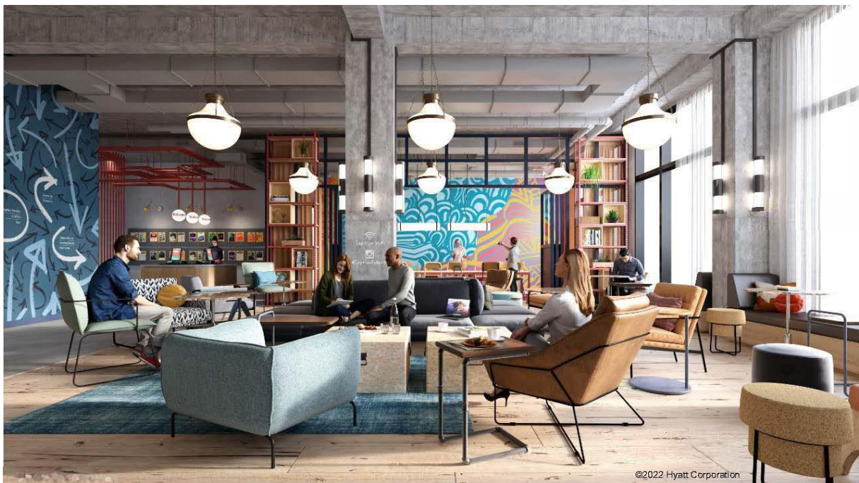
「キャプション by Hyatt」のトークショップ（Talk Shop）イメージ

本ホテルは当社によるホテル経営事業の第一号案件であり、当社が開発、ハイアットが運営するものです。本ホテルは当社が2020年4月に策定した新中期経営計画「Challenge&Progress」において「兜町12プロジェクト（旧プロジェクトX）」と表した一棟建てホテル開発計画であり、現在2025年の開業を目指して開発を進めております。なお、「 キャプション by Hyatt 」ブランドの進出は東京初となる予定です。