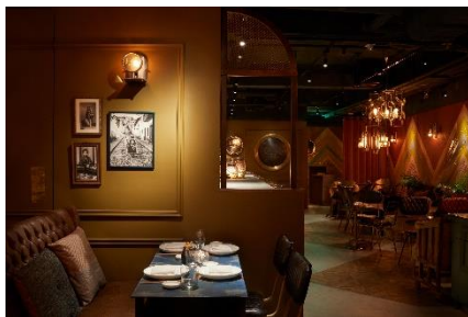
Tokyo Lima (Hong Kong)