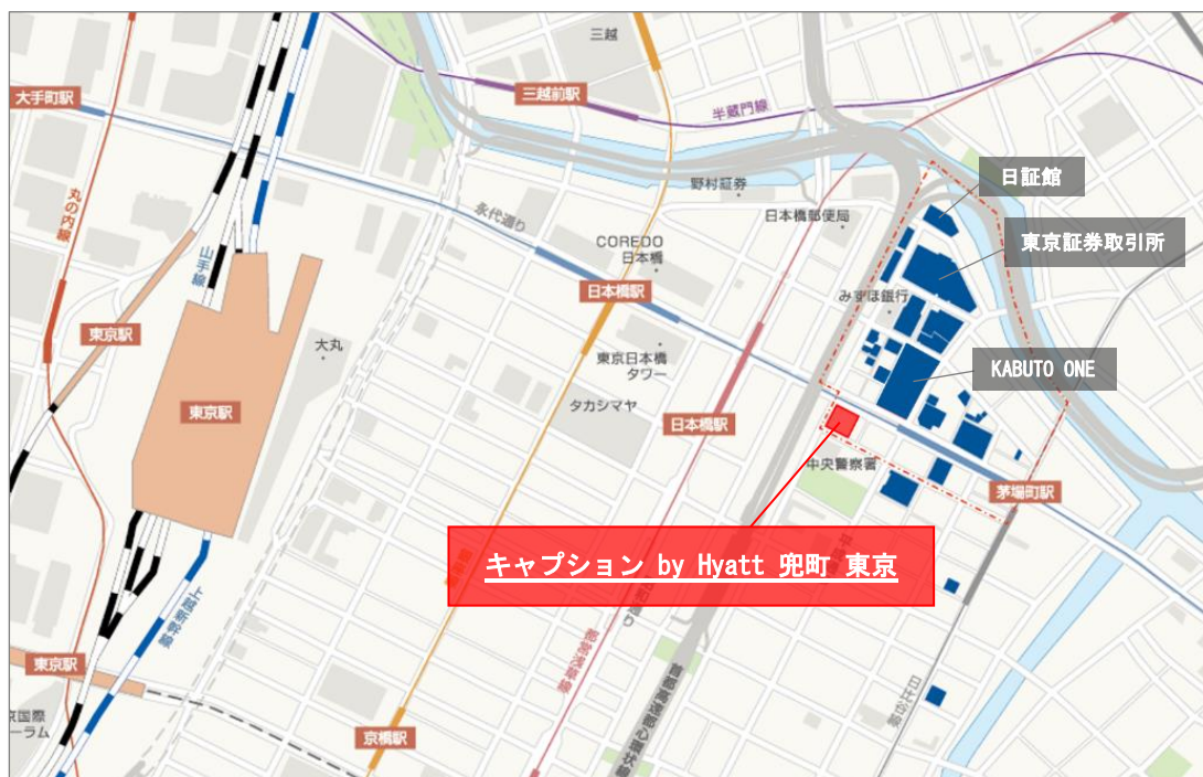
■ 当社グループ所有物件