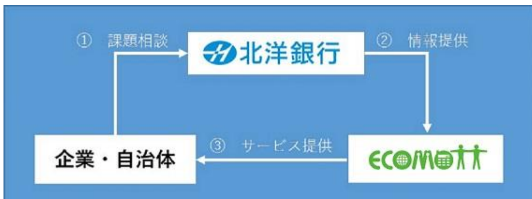
ビジネスマッチングスキーム