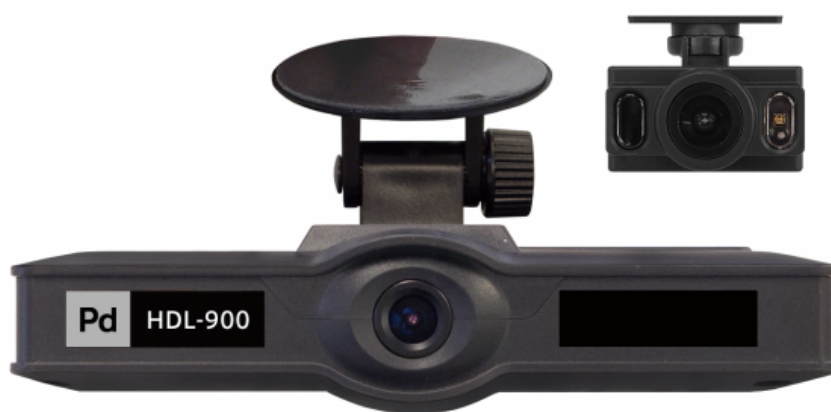
LTE通信対応高性能カーテレマティクス端末「HDL-900」

端末からクラウドまでのモバイル通信データはAES方式、端末からブラウザまではSSL/TLSによる暗号化により、ストリーミング動画のセキュアな配信が可能