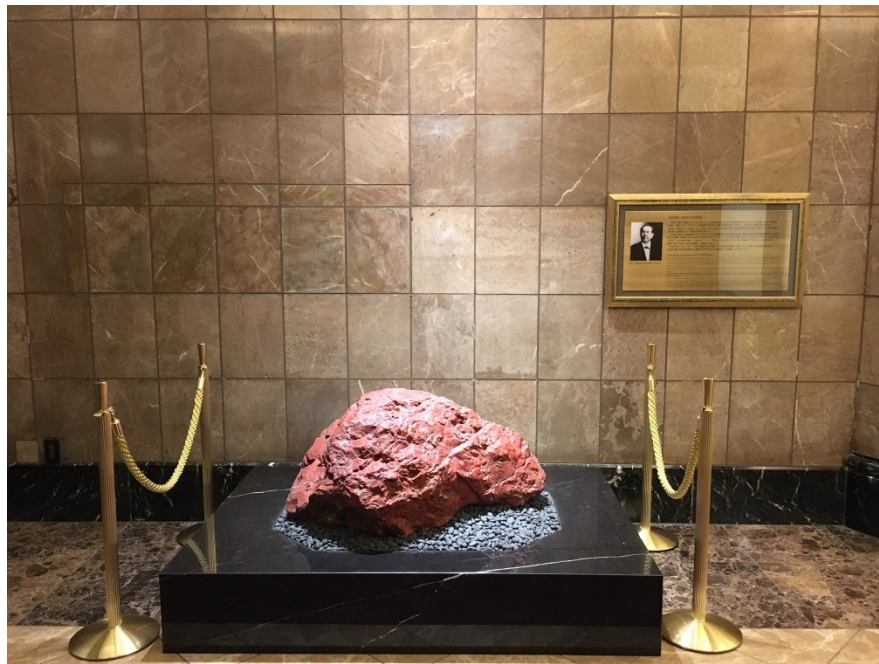
〔渋沢栄一翁ゆかりの赤石〕

日本資本主義の父と言われる渋沢栄一翁が、1888年（明治21年）に現在当社本店ビルである日証館所在地に兜町邸宅を建設した際に、日本経済の発展を祈念し縁起石として当地に設置したものです。当社では、2017年（平成29年）に、当社創立70周年記念事業の一環として本赤石を譲り受け、日証館エントランスにおいて展示しております。