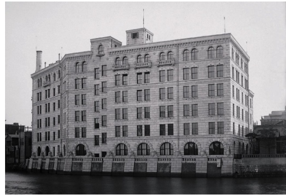
〔日証館 外観（竣工当時）〕