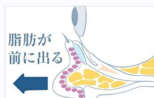
▲眼窩脂肪（がんかしぼう）が前に突出